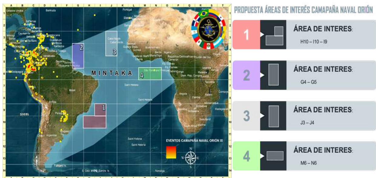
Figura 2. Propuesta de áreas de atención, corredores de tráfico de sustancias hacia África

Nota: La figura representa las áreas de interés del escenario MINTAKA, proyectado durante operación ORION sobre el corredor africano.