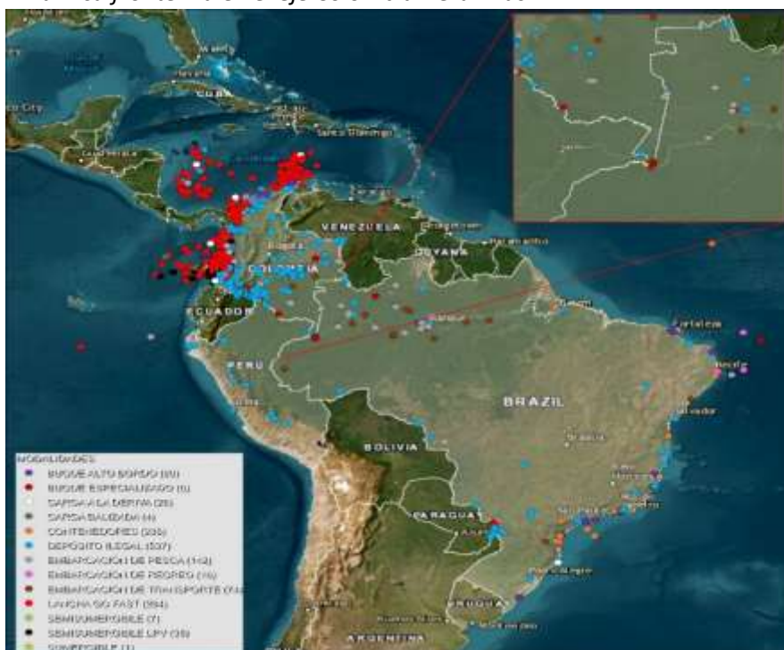
Figura 2. Dinámica fronteriza en el eje Colombia-Perú-Brasil.

Así, en este punto relevante de esta triple frontera, en el contexto de los crímenes transfronterizos, se puede mencionar que los principales problemas fronterizos son: narcotráfico, tráfico de personas, migración ilegal, minería ilegal y lavado de activos.