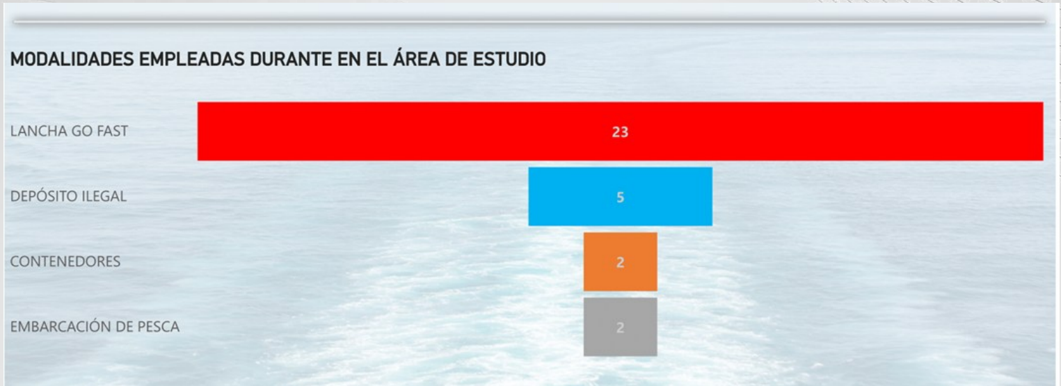
Figura 3. Modalidades utilizadas en el área general de estudio.