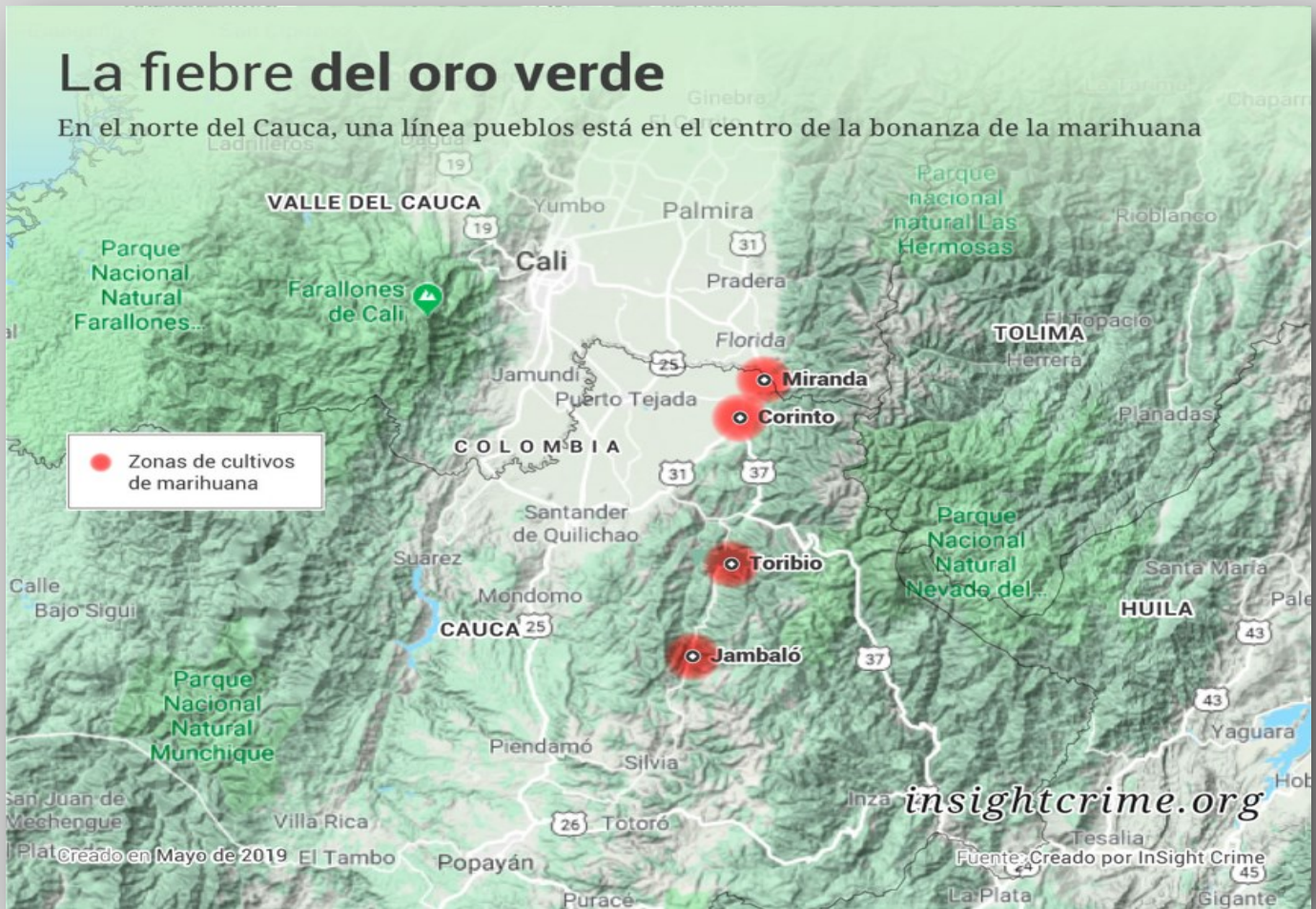
Tomado de: Robbins (2019).

A causa de la alta demanda que se registra en el continente por el consumo del cannabis, principalmente siendo la tercera sustancia más consumida en la sociedad detrás del alcohol y el tabaco; actualmente, la marihuana que se produce en el departamento del Cauca, estaría trasladándose por medios multimodales, empleando los ríos antes descritos, especialmente por el río Caquetá o Putumayo llegando hasta Brasil por medio del corredor hídrico del Amazonas (Fuentes, et al. 2015).