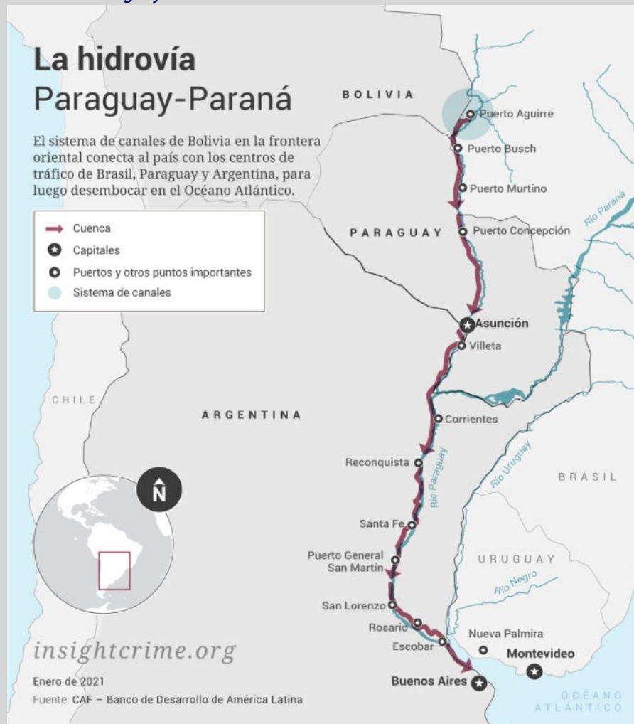
Figura 1. Hidro vía Paraguay - Paraná

Teniendo en cuenta la cantidad de CHC aprehendido, (es hasta la fecha la incautación más grande de este tipo de estupefacientes en Argentina), las autoridades tienen como hipótesis principal que la droga ingresó al país de manera ilegal por vía aérea desde Bolivia, siguiendo una cadena logística entre grupos narcotraficantes que delinquen en ambos territorios, tales como lo son las células y grupos delincuenciales conocidos como el Primer Comando Capital (PCC) y Comando Vermelho quienes son conocidos por la utilización de rutas aéreas ilegales desde Bolivia hacia Argentina, Paraguay y Brasil, siendo éste último donde tienen principal inherencia, lo que marca una tendencia en aumento en cuanto al tráfico de CHC en esta región, utilizando Argentina como país de tránsito para el tráfico de CHC hacia Europa (Infobae, 2022).